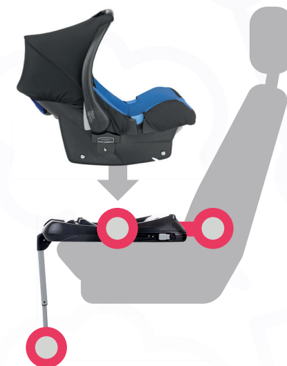
Люлька с опорой