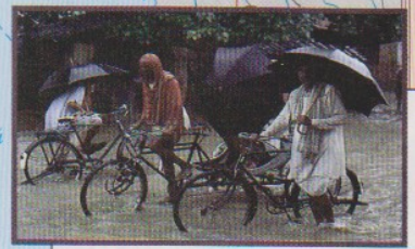
Летний муссон в Индии