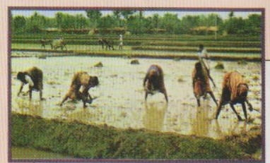
Крестьянки за посадкой риса