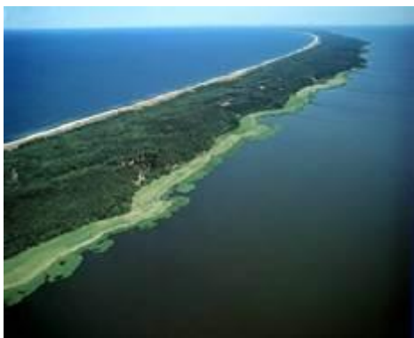
Рис. 14. Вислинская коса

Здесь на десятки километров между кромкой морской воды и уступом тянутся золотистые песчаные пляжи. Особенные природные объекты области – песчаные косы , Куршская и Вислинская (рис. 14) – с дюнами, которые закреплены посадками сосен.