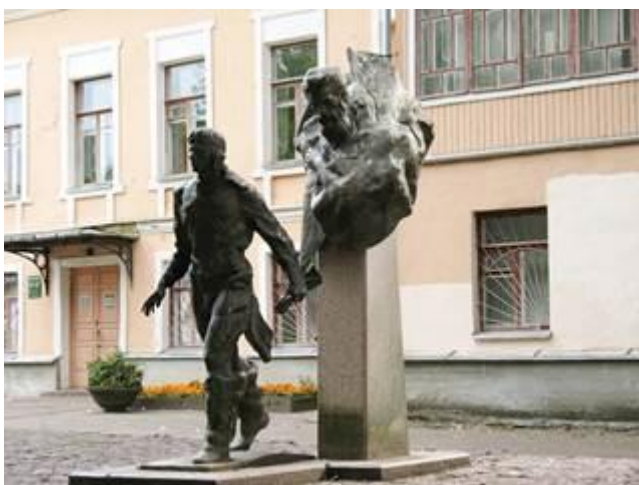
Рис. 5. Памятник литературным героям романа «Два капитана» в Пскове

В.А. Каверин родился в Пскове в 1902 г. и проучился в Псковской гимназии 6 лет. Памятник литературным героям романа «Два капитана» – Татаринову и Григорьеву – расположен в городе Пскове в сквере перед Псковской областной детской библиотекой имени В.А. Каверина (рис. 5).