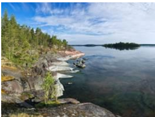
Рис. 10. Ладожское озеро

Минеральными ресурсами район не богат, здесь есть (рис. 11):