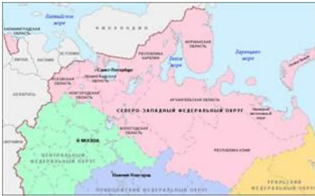
Рис. 2. Карта Северо-Запада России

Северо-Западный регион граничит с Беларуссией, Латвией, Эстонией, Финляндией, а Калининградская область – с Польшей и Литвой. По территории района проходят железнодорожные и автомобильные дороги, которые от Санкт-Петербурга веером расходятся во все соседние территории. Экономико-географическое положение района со временем менялось. Так как регион находился на торговом пути «из варяг в греки», то был заселен рано. Здесь располагаются древнерусские города: Великий Новгород, Псков, Великие Луки, Старая Русса. В начале XVII в. выход в Балтийское море был закрыт шведами, и только после победы над шведами он был возвращен в состав России.