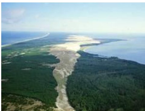
Рис. 13. Самбийская возвышенность

Поверхность сглажена, с небольшими высотами (рис. 12). На ней чередуются волнистые низменные пространства с отдельными холмисто-грядовыми ледниковыми возвышенностями. На северном побережье расположена Самбийская возвышенность , которая крутым уступом обрывается к морю (рис. 13).