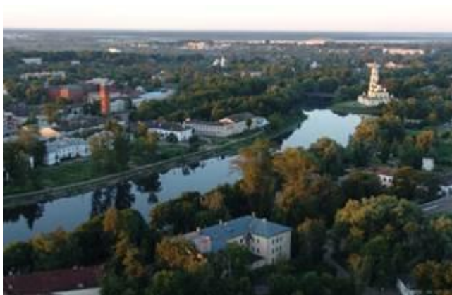
Рис. 7. Старая Русса

Старая Русса (рис. 7) – городок, который уютно разместился в устье реки Порусье . Существует мнение, что? основанный не позднее X в., этот город дал название всей России и стал родиной варяга – солевара Рюрика .