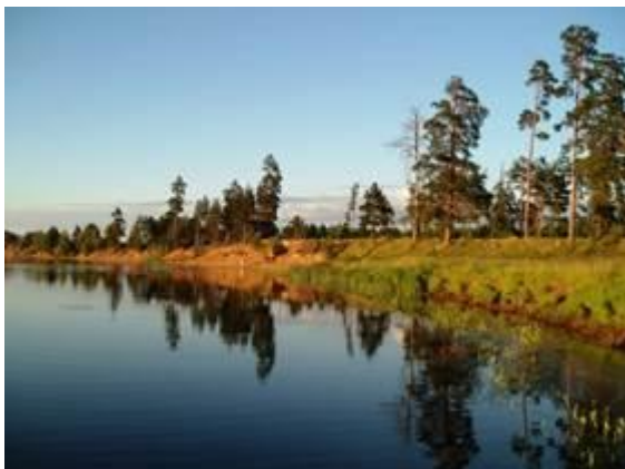
Рис. 6. Пейзаж Северо-Запада России

дуб, клен, бязь, ясень. Больше всего березовых и осиновых лесов, которые заполняют места вырубок. Европейский Северо-Запад представляет собой равнинную территорию с плавными очертаниями и различными отметками высот (рис. 6).