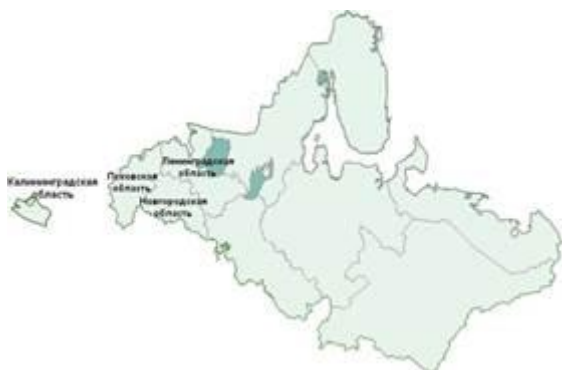
Рис. 1. Карта Северо-Западного региона (Северный и Северо-Западный районы) ( Источник )

В состав Северо-Западного региона входят Ленинградская, Псковская и Новгородская области, город федерального значения Санкт-Петербург и полуанклав Калининградская область.