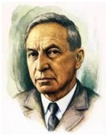
Рис. 4. В.А. Каверин ( Источник )

Рис. 3. Псковская область на карте России ( Источник ) «Бороться и искать, найти и не сдаваться» – девиз главного героя литературного произведения В.А. Каверина (рис. 4) « Два капитана ».