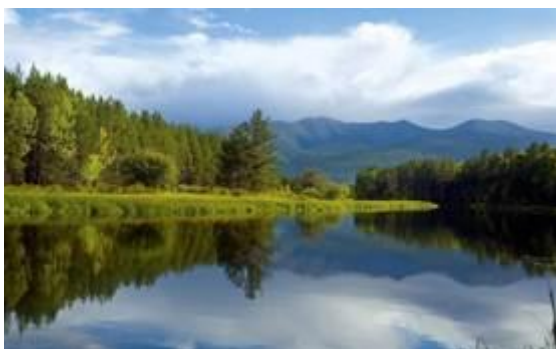
Рис. 15. Природа Калининградской области

Растительный покров Янтарного края сильно изменен человеком. Всего лишь четверть территории покрыта небольшими массивами елово-дубовых и сосново-березовых лесов. Издавна вырубались широколиственные леса из дуба, липы, граба. Около 40 % лесов – это искусственные посадки (рис. 15).