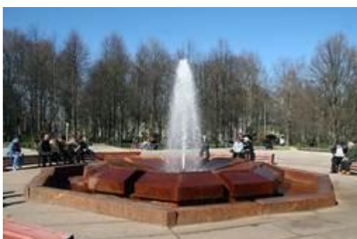
Рис. 9. Фонтан минеральной воды

Сейчас Старая Русса – это третий по численности город в Новгородской области и знаменитый Старорусский курорт , замечательный своими естественными минеральными фонтанами соленой воды , бьющими из-под земли (в некоторых местах до 10 м в высоту) (рис. 9).