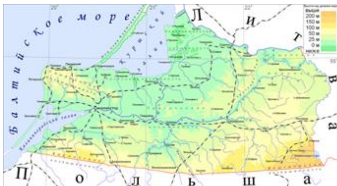
Рис. 12. Карта Калининградской области

мокрым снегом делают погоду влажной и пасмурной. В течение года бывает всего 60–65 дней с ясной погодой. Часты ветры , которые обычно дуют с юго-запада со скоростью 5–6 м/с. Всего 4–5 дней в месяце бывают абсолютно спокойными, штилевыми. Осадков выпадает много – 750–940 мм. Около 50 раз в году бывают штормовые предупреждения.